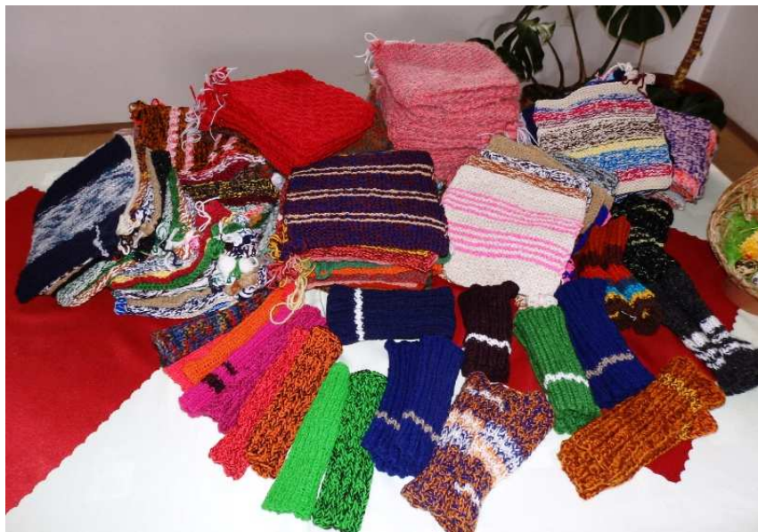
Ukázka darů "Pleteme pro Afriku"