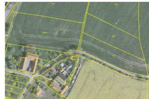
Ortofoto s obrazem katastrální mapy po obnově katastrálního operátu

Po skončení prací na obnově katastrálního operátu dochází k vyhlášení jeho platnosti. Podle § 58 odst. 2 vyhlášky č. 357/2013 Sb., katastrální vyhláška, zašle katastrální úřad sdělení o vyhlášení platnosti obnoveného katastrálního operátu obci, na jejímž území byl katastrální operát obnoven. Obec zveřejní tuto informaci v místě obvyklým způsobem. Katastrální úřad a Český úřad zeměměřický a katastrální zveřejní vyhlášení platnosti obnoveného katastrálního operátu rovněž na svých internetových stránkách.