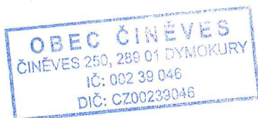
..... Ing. Zuzana Bittmanová Starostka

dne 30. 5. 2016 jste podal žádost na obecní úřad č.j. ČIN/339/2016 – Nájemní smlouva – vodárenský domek. Tímto Vám sdělujeme, že informace bude dle § 17 zákona č. 106/1999 Sb., o svobodném přístupu k informacím, poskytnuta po prokázání úhrady celkových nákladů na její podání. Uhrad'te částku 4,- Kč za zhotovení kopií na obecním úřadě.