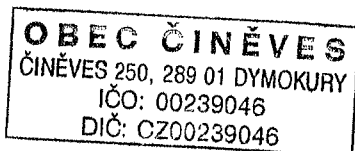
..... Ing. Zuzana Bittmanová Starostka

dne 8. 04. 2019 jste podal žádost na obecní úřad Činěves, řazenou pod č.j. ČIN/179/2019 o poskytnutí informací. V souladu s §14 odst. 5 písm. d) zákona č. 106/1999 Sb., o svobodném přístupu k informacím, Vám tímto Vám tímto oznamuji, že kopie smlouvy na poskytnutí dotace na rekonstrukci mateřské školy, jsou připraveny v podatelně na obecním úřadě a budou Vám vydány po uhrazení částky 30,- Kč za zhotovení kopií.