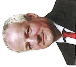
Prof. MUDr. Roman Prymula, CSc., Ph.D. Epidemiolog