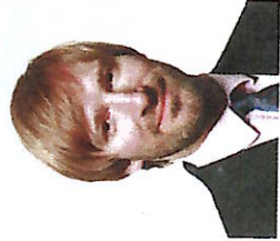
Mgr. et Mgr. Adam Vojtěch, MHA Ministr zdravotnictví