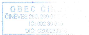
..... Ing. Zuzana Bittmanová Starostka obce Činěves

Dne 1. 11. 2017 jste podala žádost na obecní úřad Činěves, řazenou pod č.j. ČIN/612/2017 – jména a příjmení všech uvolněných zastupitelů a zastupitelek ve vašem zastupitelstvu - o poskytnutí informací. V souladu s §14 odst. 5 písm. d) zákona č. 106/1999 Sb., o svobodném přístupu k informacím, zpřístupňujeme následující informaci: v zastupitelstvu obce Činěves nejsou uvolněni zastupitelé.